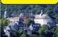
Fußweg Bad Berleburg Besichtigung Schloss Berleburg ca. 40 Minuten