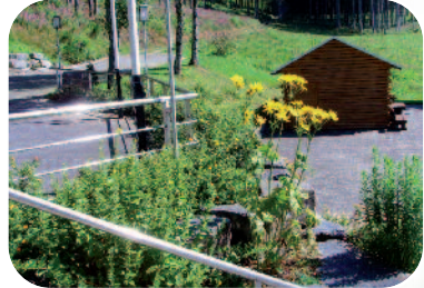
Aussenbereich mit Blick in Richtung Bad Berleburg