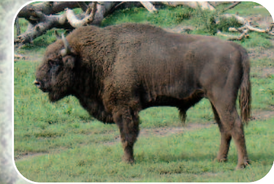
Ausgewilderte Wisente am Rothaarsteig